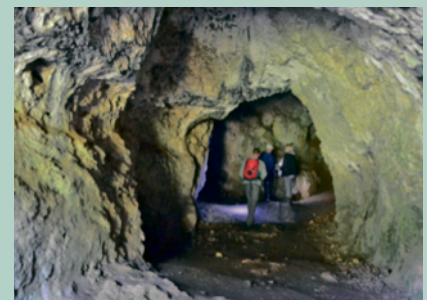
Rohenloch bei Viehhofen