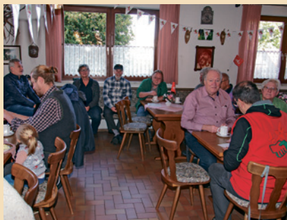
Viele Gäste im NF-Haus

Großer Andrang und zeitweise ein volles Haus machten den Tag der offenen Tür des NF-Hauses am Kreuzfelsen zum vollen Erfolg. Die offene Tür nutzten Jung und Alt und die OG der Naturfreunde Großengsee/Ittling war begeistert. Unser Ziel, (wieder) neues Leben für die Naturfreundebewegung unter dem Dach unseres Naturfreundeheimes anzuregen, wurde mit ca. 200 Gästen mehr als erreicht. Aus der Initiative „Rettet Großengsee“ einzelner Mitglieder der OG Nürnberg-Mitte entstand der Vorschlag mit dem „Tag der offenen Tür“ die „Wiederbelebung“ der Naturfreundebewegung mit ihrem Naturfreundehaus zu starten.