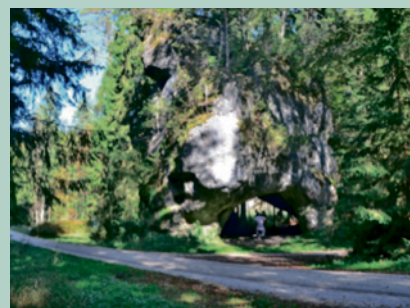
Großer Lochstein im Veldensteiner Forst

Unter den 21 Aufschlüssen und Höhlen gab es natürlich auch einige Glanzpunkte, wie das Felsenlabyrinth beim Forsthaus Sackdilling, den Kallmünzer nördlich von Pruihausen (Quarzit-Härtling), den Wasserberg bei Pegnitz (wo ein Teil der jungen Pegnitz 320 Meter durch den Berg fließt), den Großen Lochstein im Veldensteiner Forst, die Steinerne Rinne bei Raschbach (nördlich von Altdorf), die Dünen bei Weißenbrunn (Dünen aus quartären Flugsanden, die früher abgebaut wurden jetzt jedoch teilweise als Natur- und Wasserschutzgebiet ausgewiesen sind) und drei