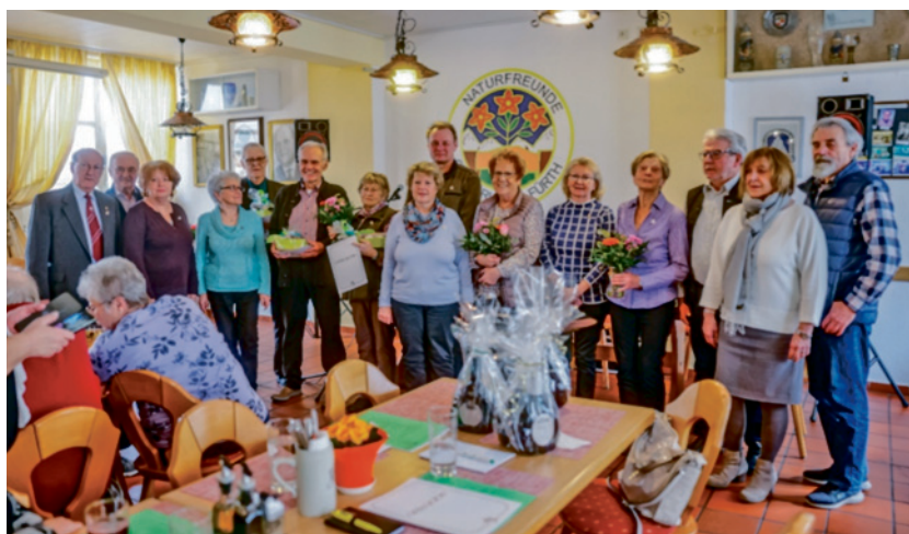
Die Jubilare der Ortsgruppe Fürth