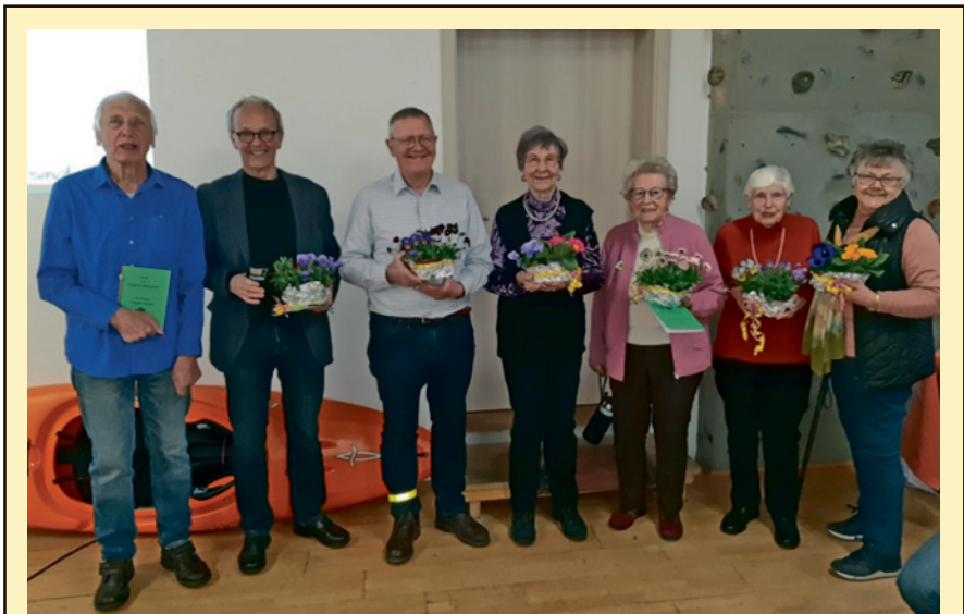
Ehrung langjähriger Mitglieder der OG Erlangen bei der Jahreshauptversammlung

Wir werden ihr stets ein ehrendes Gedenken bewahren