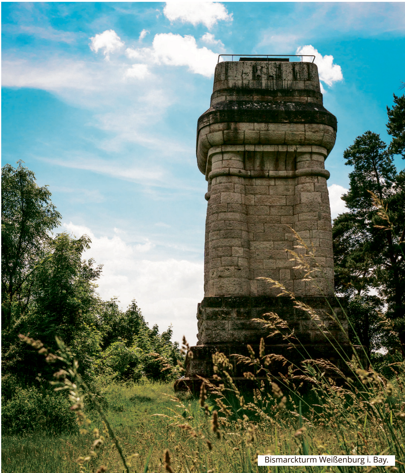
Bismarckturm Weißenburg i. Bay.