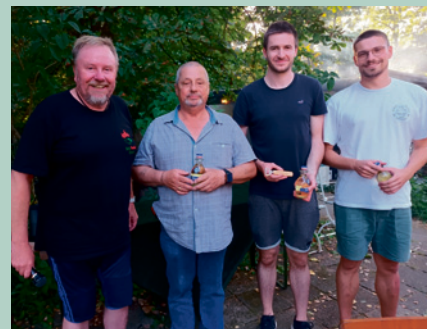
Sieger im Einzel

Da freuen wir uns doch alle schon aufs nächste Jahr, wenn's wieder heißt: „Etz muß a Schellerer her!“