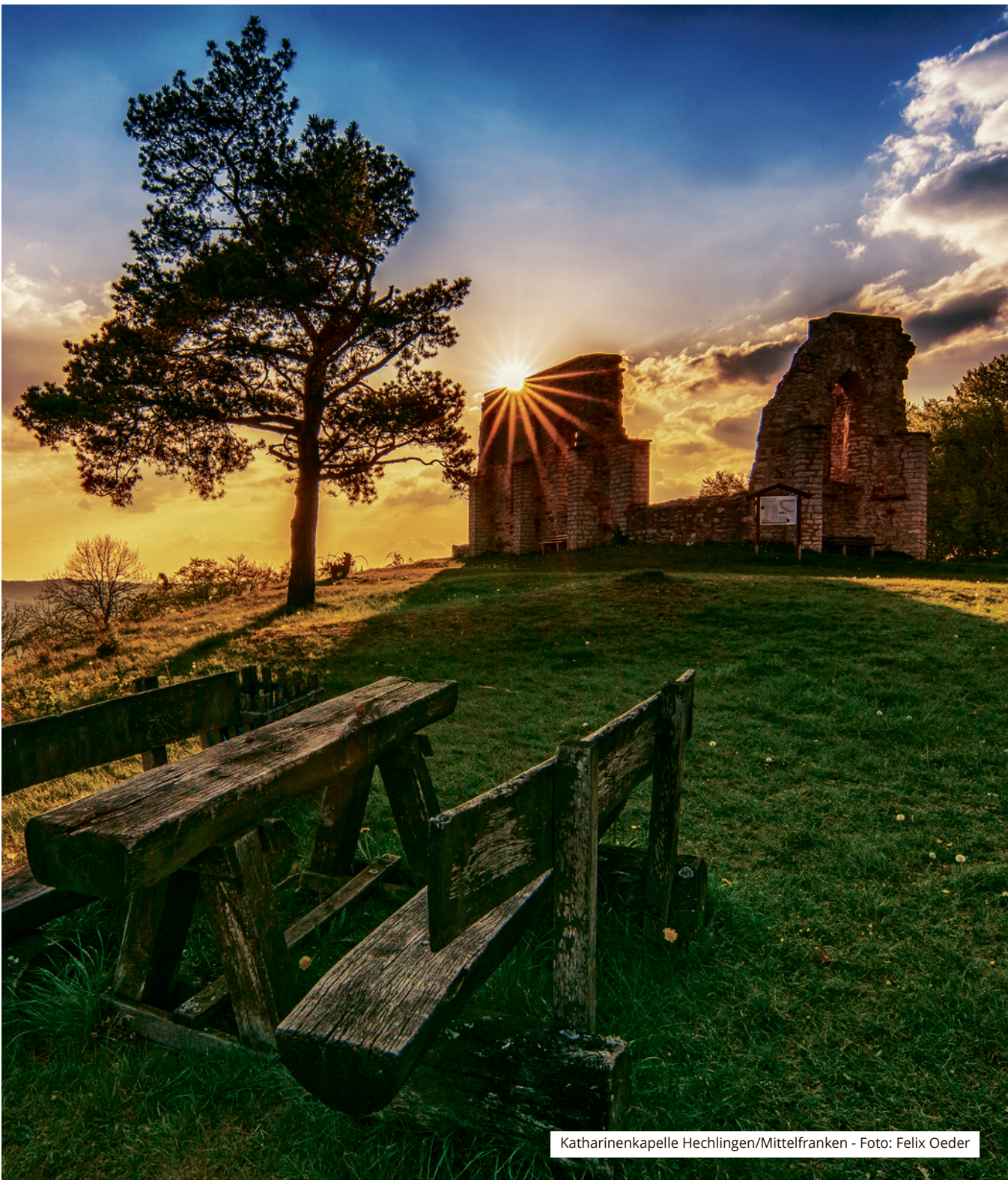
Katharinenkapelle Hechlingen/Mittelfranken