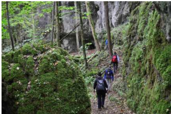
Bild 3 Felsenlabyrinth Sackdilling

Das Sackdillinger Felsenlabyrinth besteht aus