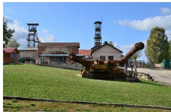
Bild 4 Bergbaumuseum Maffeischächte Nitzbuch

Deshalb besuchten wir das Bergbau-Museum Maffeischächte der Grube Nitzbuch bei Auerbach.