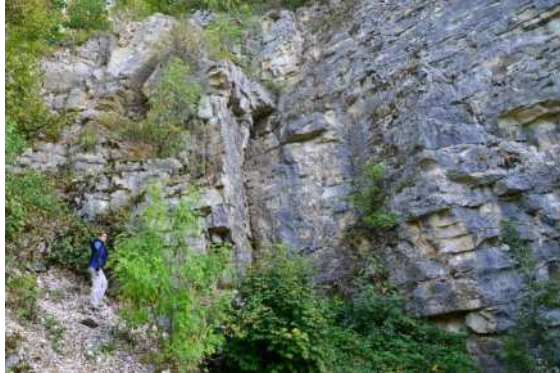
Bild 5 Steinbruch oberhalb Happurg

Als erstes am heutigen Tag suchten wir den ehemaligen Steinbruch oberhalb Happurgs