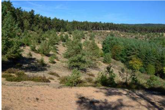
Bild 8 Flugsanddünen westlich von Weißenbrunn

Ja, es gibt sie wirklich, Sanddünen wenige Kilometer östlich von Nürnberg. Die Dünen bei