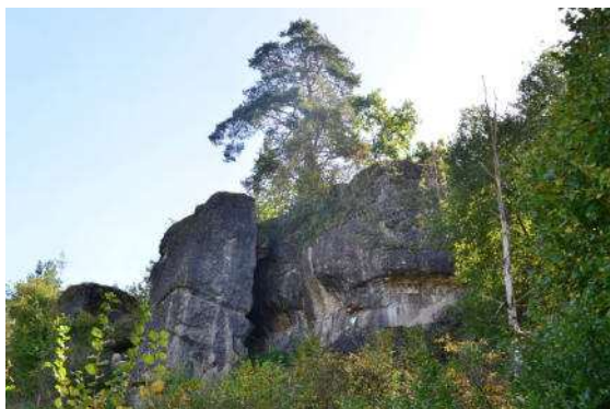
Bild 12 Hutterichsfelsen bei Hammerbühl

Am Weg zum Veldensteiner Forst machten wir Halt am Hutterichsfelsen.