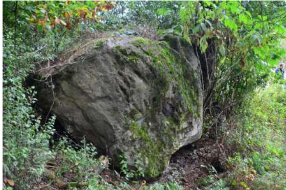
Bild 2 Kallmünzer nördlich von Pruihausen

In manchen Sandsteinlagen der Kreidezeit kam es durch kieselsäurehaltiges Grundwasser