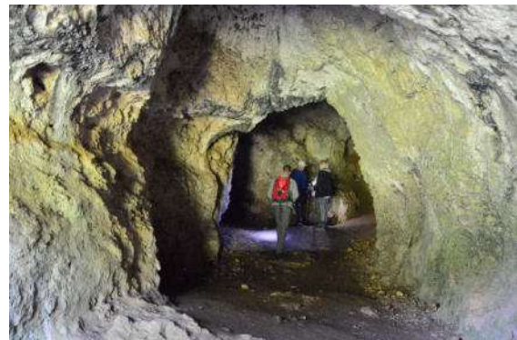
Bild 17 Raumhöhle bei Viehhofen

Heute am „Karst- und Höhlentag“ besuchten wir im Rahmen einer kleinen Rundwanderung drei Karsthöhlen, als erstes die Raumhöhle.