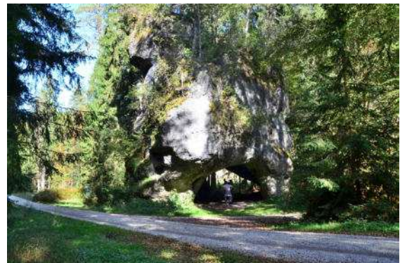
Bild 14 Großer Lochstein im Veldensteiner Forst

Das Ziel der Wanderung war das wohl eindrucksvollste Felsgebilde im Gebiet des Veldensteiner Forstes, der „Große Lochstein“.