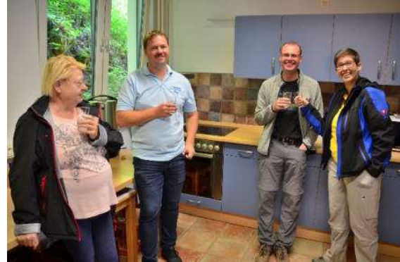
Bild 9 Wasserverkostung bei der Juragruppe Pegnitz

Nach dem Frühstück besuchten wir den Standort der Juragruppe, Zweckverband Wasserversorgung in der Stadt Pegnitz.