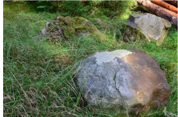
Bild 13 Kallmünzerblöcke im Vogelherd

Es folgte eine etwas längere Wanderung, wir stellten die Autos in der Nähe von Horlach ab, unser Ziel war der „Große Lochstein“.