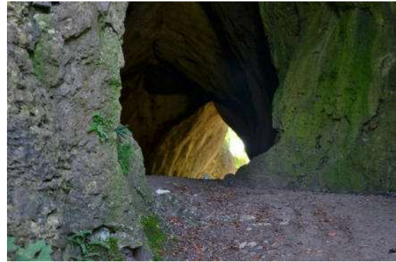
Bild 20 Klauskirche bei Betzenstein

Die letzte geologische Attraktion des heutigen Tages und dieser Exkursion erreichten wir nach einer kurzen Autofahrt und wenigen Wanderschritten, die Durchgangshöhle „Klauskirche“ bei Betzenstein.