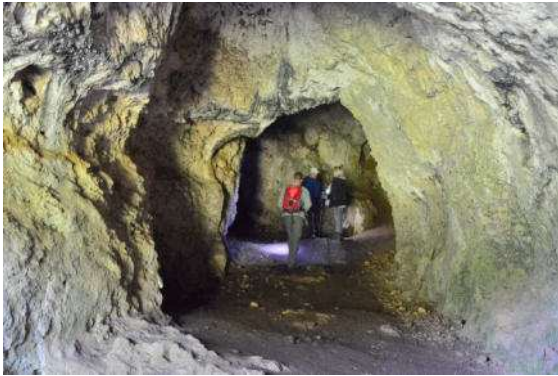
Bild 18 Großes Rohenloch östlich von Viehhofen

Das Große Rohenloch ist eine Halbhöhle von etwa 70 Metern Gesamtlänge und einer rund 50 Quadratmeter großen Halle. Durch Grabungen konnte nachgewiesen werden, dass die Höhle bereits in der Jungsteinzeit bewohnt war, dabei wurden auch pleistozäne Fauna und prähistorische Funde gemacht