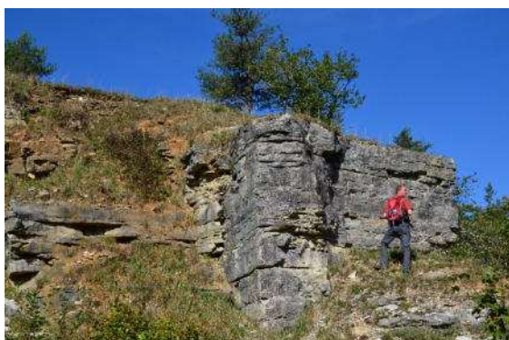
Bild 6 Ehemaliger Steinbruch bei Schupf

Wie auch das vorher besuchte Geotop ist dieser Steinbruch teilweise zugewachsen und wird von Sportschützen als Tontauben-Schießstand benutzt. Die Hinterlassenschaften dieses Hobbies verschmutzen leider den Aufschluss in erheblicher Weise, vor allem der Plastikmüll, der überall rumliegt, erscheint sehr bedenklich.