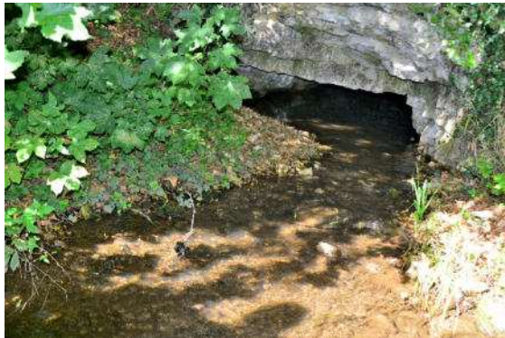
Bild 11 Wasserberg Pegnitz, Hauptaustrittsstelle

der Mühlbach am Nordhang des Berges einen Teil seines Wassers in Klüften des Kalkes und in eine Ponorhöhle, welche ein stark verzweigtes Gangsystem im stark zerklüfteten und brüchigen Werkkalk bildet. Während der oberirdische Fluss „Pegnitz“ etwa 15 Minuten benötigt, den Berg zu umfließen, beträgt die Fließgeschwindigkeit des „unterirdischen“ Mühlbachs bei gleichem Gefälle etwa 120 Minuten.