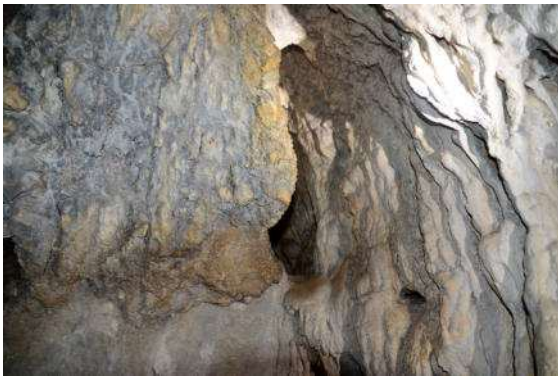
Bild 19 Saalburg-Grotte östlich von Viehhofen

Die dritte Höhle der Wanderung, die „Saalburggrotte“ ist zwar eine kleine, aber dennoch sehr attraktive Höhle.