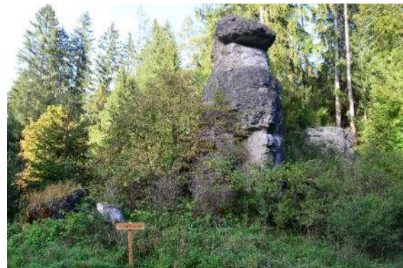
Bild 16 Schmierhüttenfelsen bei Mosenberg

Nahe beim Wasserwerk Ranna, das zum Teil die Stadt Nürnberg mit Trinkwasser versorgt, liegt das Geotop „Schmierhüttenfelsen“. Der eindrucksvolle 10 x 5 Meter große Frankendolomit besteht aus Felsturm und Felsblock.