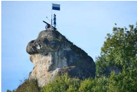
Bild 15 Kanonier von Weidlwang

Auf dem markanten, hochaufragenden Frankendolomitenfelsen in Weidlwang steht eine Kanone mit Soldatenfigur, dazu gibt es eine Begebenheit aus dem 30-jährigen Krieg: