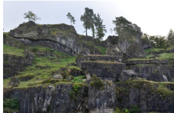
Bild 1 Schafberg bei Loch/Königstein

Direkt hinter der Ortschaft Loch am Nord-