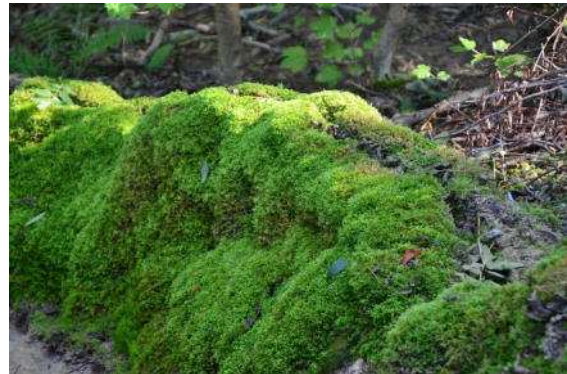
Bild 7 Steinerne Rinne bei Raschbach

Vor der kleinen Wanderung zur Steinernen Rinne bei Raschbach verzehrten wir erst mal unser Lunchpaket, wobei uns die Ziegen des angrenzenden Geheges zusahen.