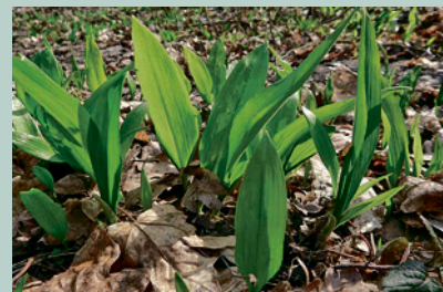
Ruine Speckfeld 28. März 2021:

Nach dem Frost spitzte die Sonne durch die Wolken, erwärmte den Boden und die Temperaturen stiegen deutlich über dem Nullpunkt. Vielleicht blühen ja bereits die ersten Märzenbecher, überlegten wir und suchten den uns bekannten Standort im Limpurger Forst unterhalb des Schlossbuchs auf. Tatsächlich waren die meisten Märzenbecher bereits aufgeblüht, hier sind sie auch immer sehr früh dran, früher als in der „Schwander Soos“. Nur Leberblümchen fanden wir noch keine, doch das sollte sich später bei der Ruine Speckfeld ändern. Abgerundet wurde die Märzenbecher-Besichtigung durch eine Wanderrunde zu dem Gipssteinbruch Markt Bibart.