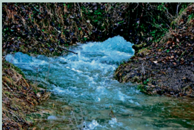
Tummler oder Hungerbrunnen im Leinleittal 4. Februar 2021:

Es schneite bereits seit Tagen und wir wollten uns den Winterwald um Betzenstein beim Veldensteiner Forst mal ansehen. Allerdings war das Wandern aufgrund der Schneehöhe von 40 cm bis 50 cm sehr beschwerlich. Nach ca. 2 km von Betzenstein aus in Richtung Stierberg kehrten wir wieder um und stapften über die Klauskirche wieder zurück, so dass wir nach 4,5 km Wegstrecke wieder am Auto waren, um dort die mitgebrachte Vesper zu verzehren. So viel Schnee im Frankenjura haben wir schon lange nicht mehr gesehen.