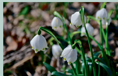
Märzenbecher 28. Februar 2021:

Nach dem Frost spitzte die Sonne durch die Wolken, erwärmte den Boden und die Temperaturen stiegen deutlich über dem Nullpunkt. Vielleicht blühen ja bereits die ersten Märzenbecher, überlegten wir und suchten den uns bekannten Standort im Limpurger Forst unterhalb des Schlossbuchs auf. Tatsächlich waren die meisten Märzenbecher bereits aufgeblüht, hier sind sie auch immer sehr früh dran, früher als in der „Schwander Soos“. Nur Leberblümchen fanden wir noch keine, doch das sollte sich später bei der Ruine Speckfeld ändern. Abgerundet wurde die Märzenbecher-Besichtigung durch eine Wanderrunde zu dem Gipssteinbruch Markt Bibart.