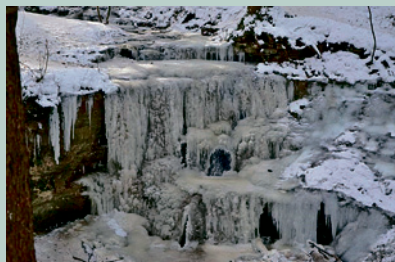
Klingender Wasserfall 15. Februar 2021:

brunnen im Leinleittal zu besuchen. Normalerweise ist der Talboden trocken, nur nach längeren Regenfällen und/oder Tauwetter führen die beiden Karstquellen Großer und Kleiner Tummler Wasser. Sie befinden sich ca. 1,8 km talaufwärts der Heroldsmühle. Wir hatten den Zeitpunkt gut erwischt, der Zugang bis zu den Tummlern war trockenen Fußes nur von der Ortschaft Hohenpözl aus möglich. Beide Karstquellen schütteten so viel Wasser, dass unterhalb der Tummler das Tal überflutet war. Ein seltenes Naturschauspiel.