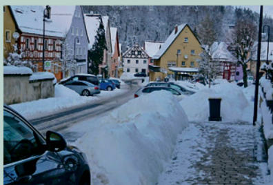
Betzenstein 27. Januar 2021:

nachdem wir uns noch immer nicht zu Mitgliederabenden oder gemeinsamen Wanderungen treffen dürfen, hier ein kurzer Bericht, welche Wanderziele wir zu zweit im Corona-Winter/Frühjahr 2021 ansteuerten. Wenn möglich, gingen wir unter der Woche raus, um nicht so vielen Leuten zu begegnen.