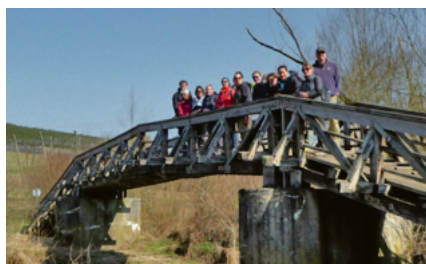
Wanderung rund um Spalt

Genaue Informationen zu diesen und weiteren Veranstaltungen findest du auf unserer Internetseite.