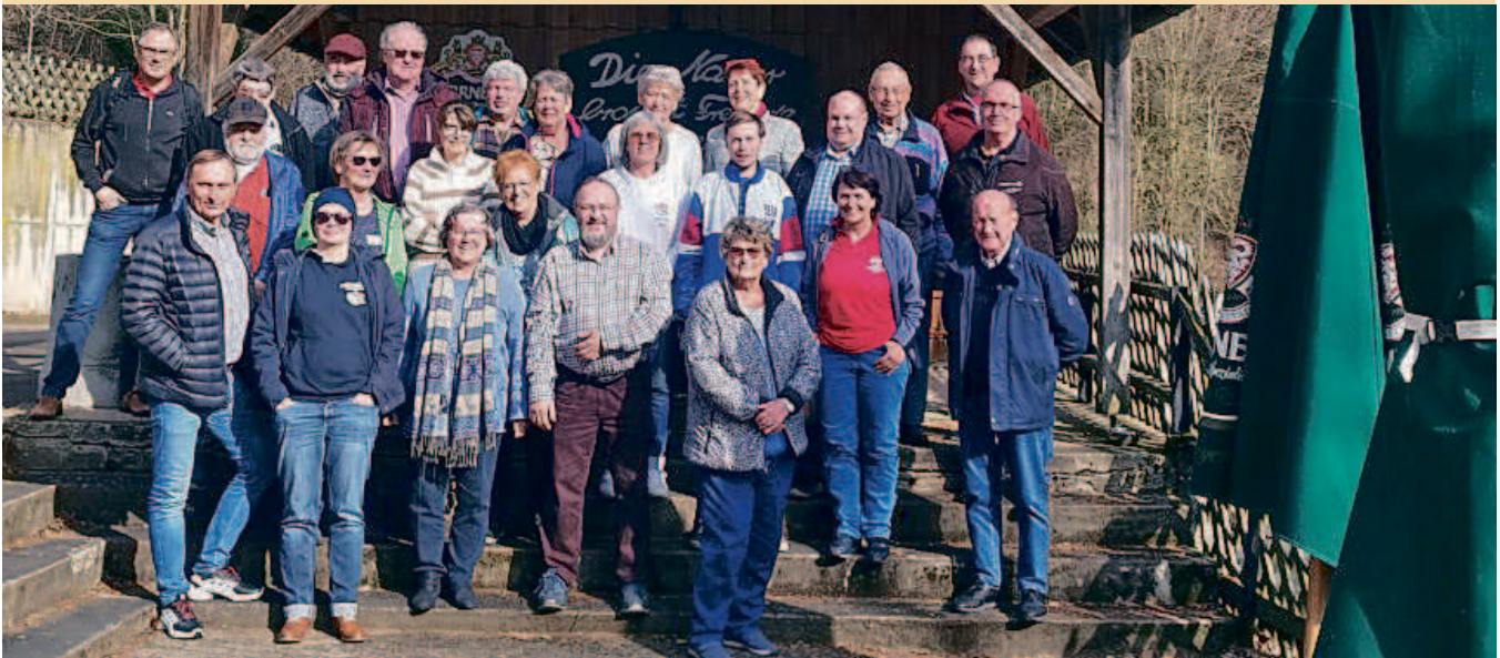
Die Delegierten der Bezirkskonferenz Mittelfranken

Es geht um die Sicherung und Bewahrung unserer Demokratie: Nie wieder ist jetzt!