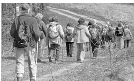
Wanderung 9. April an der ehemaligen Zonengrenze von Hirschberg nach Mödlareuth.