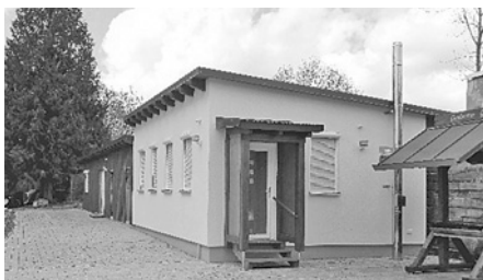
Neue Nebengebäude am NaturFreundehaus „Gumbertushütte“ der OG Ansbach

Die NaturFreunde Ansbach bedanken sich ganz herzlich für den Besuch anlässlich unserer Einweihungsfeier der neuen Nebengebäude und Sonnwendfeier am 25. Juni 2016. Wir durften einige Mitglieder der OG Schwabach und den 1. und 2. Vorsitzenden mit ihren Partnern begrüßen.