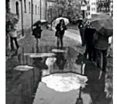
Das neue Denkmal zum Gedenken an die Hexenverfolgung in Bamberg.