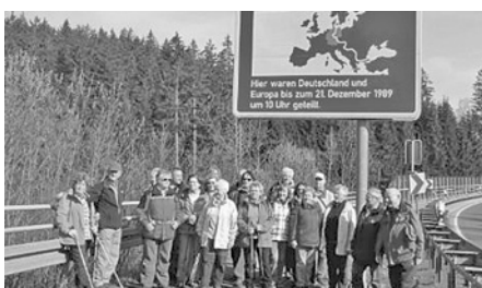
Die Wester Natur-Freunde an der Zonen-Grenze (geteilte Grenze bis 21. Dezember 1989).