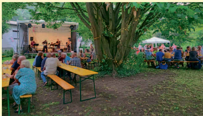
Eindrücke von der Sonnwendfeier mit dem Stadtverband der Erlanger Kulturvereine