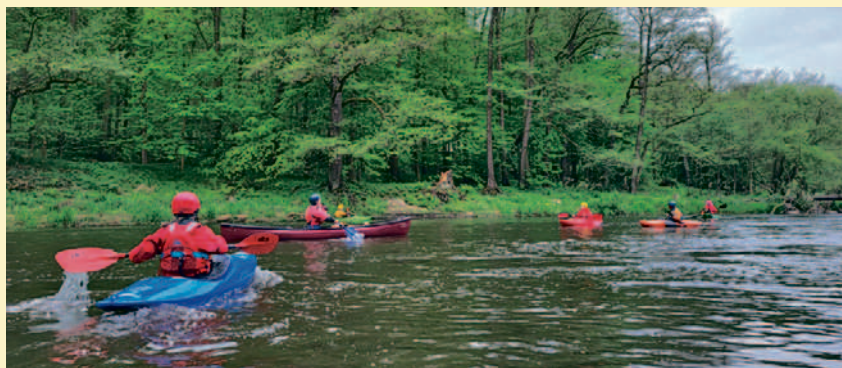
Gemeinschaftsfahrt mit den Naturfreunden aus Hof, nach Karlsbad an die Eger