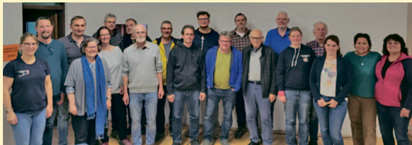
Unsere frisch gewählten Ehrenamtlichen – Danke für euren Einsatz

Kontakt: NFE-Vorstandsteam@naturfreunde-erlangen.de