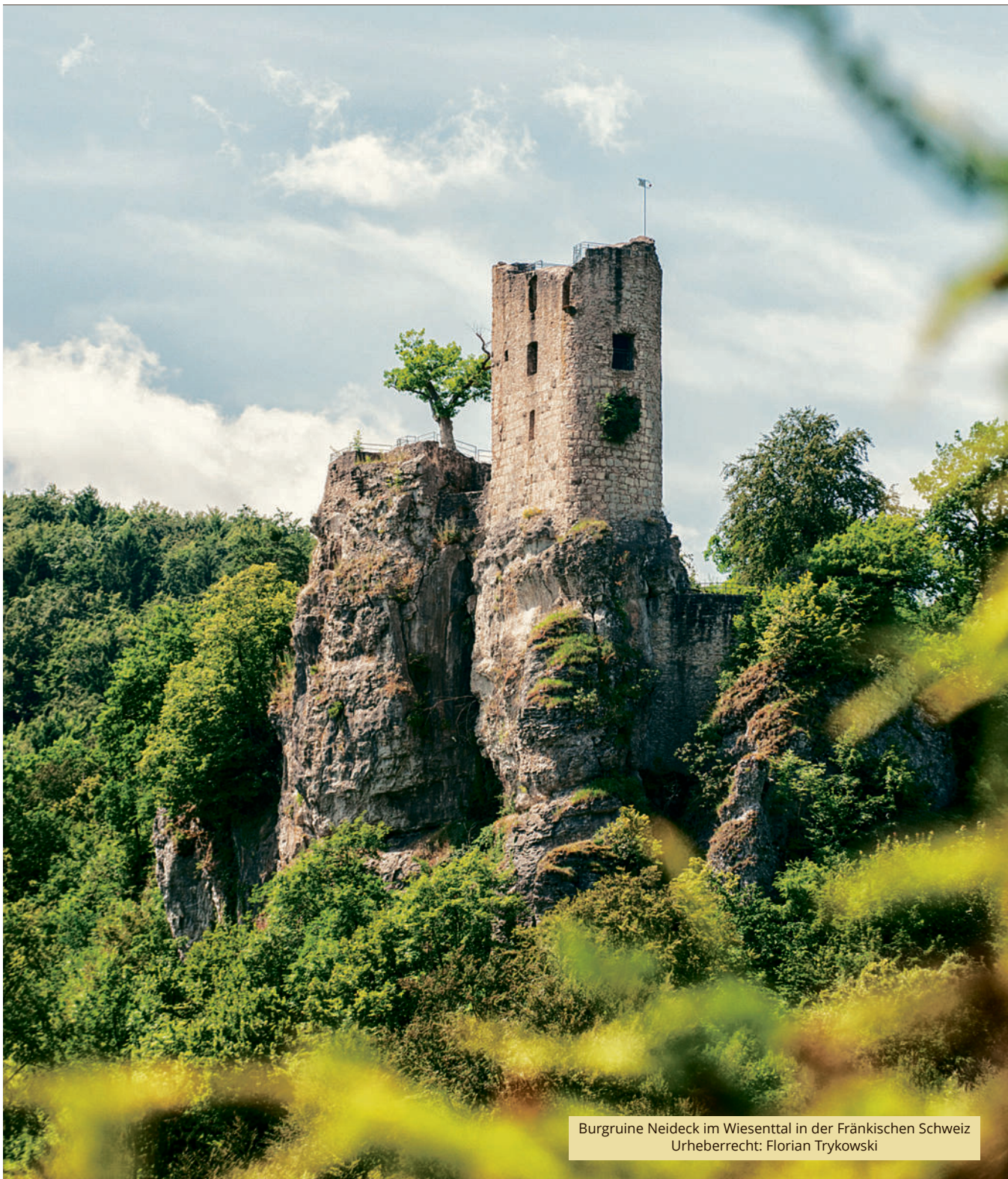
Burgruine Neideck im Wiesenttal in der Fränkischen Schweiz