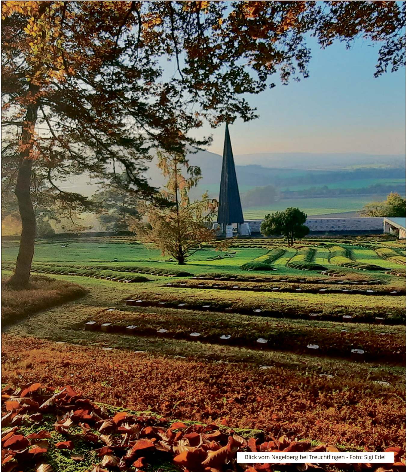
Blick vom Nagelberg bei Treuchtlingen - Foto: Sigi Edel